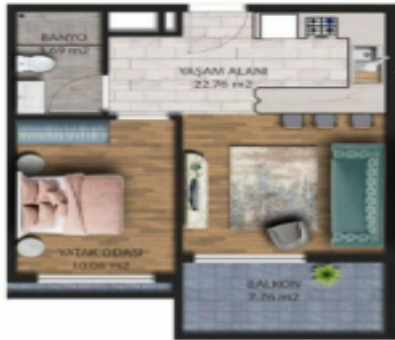
TIP 2 DAİRE PLANI