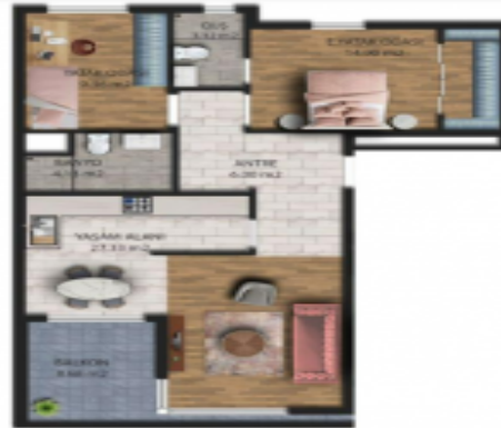
TIP 1 DAİRE PLANI