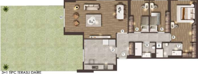
3+1 TİPÇ TERASLI DAİRE

NET ALAN = 109,60 m 2 BRÜT ALAN = 158,90 m 2 TERAS ALAN = 132,20 m 2