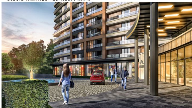
AVRUPA KONUTLARI SAKLIVADI PROJESİ