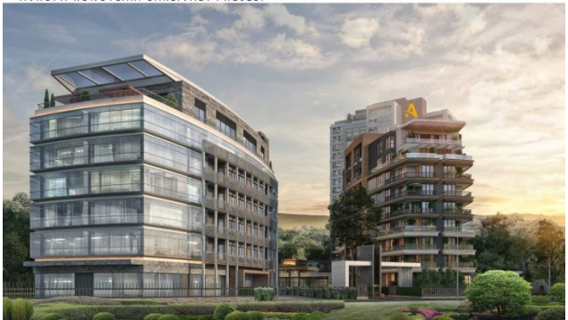
AVRUPA KONUTLARI SAKLIVADI PROJESI