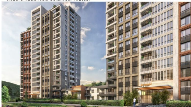
AVRUPA KONUTLARI SAKLIVADI PROJESİ