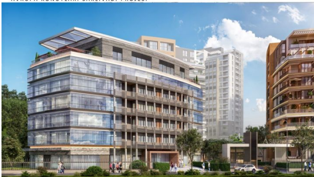
AVRUPA KONUTLARI SAKLIVADI PROJESİ