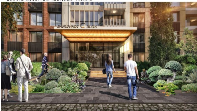
AVRUPA KONUTLARI SAKLIVADI PROJESİ