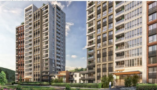
AVRUPA KONUTLARI SAKLIVADI PROJESI