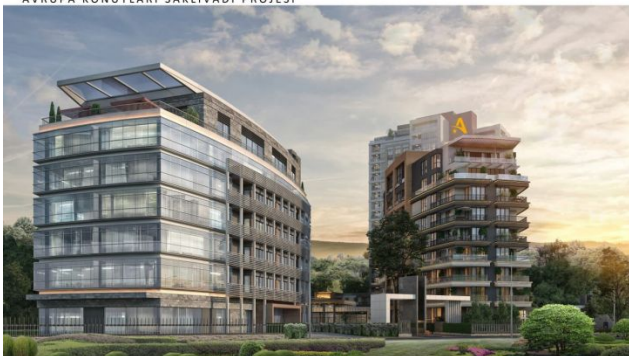
AVRUPA KONUTLARI SAKLIVADI PROJESİ