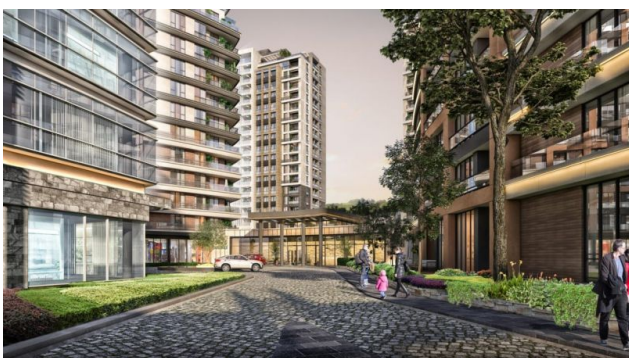
AVRUPA KONUTLARI SAKLIVADI PROJESİ