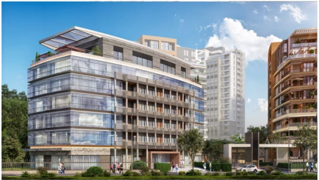
AVRUPA KONUTLARI SAKLIVADI PROJESI