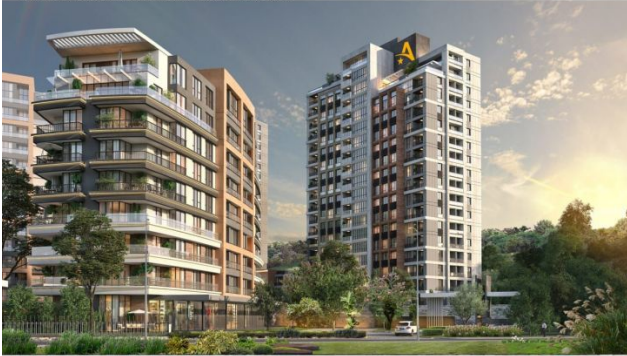
AVRUPA KONUTLARI SAKLIVADI PROJESI